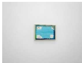
平山昌尚《6037》2016 タリオンギャラリーでの展示風景