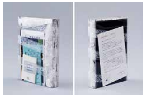
『アートプロジェクトの「言葉」に関するメディア開発:メディア/レターの届け方』2018