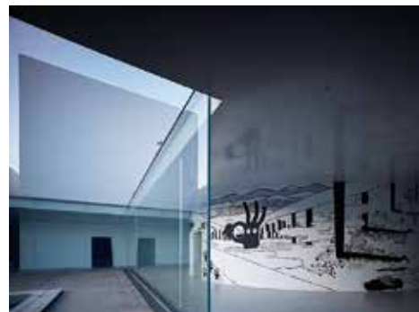
《seven years oneway》2014 (金沢21世紀美術館での公開制作)