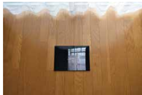
《三日間》2018 (自宅での展示)