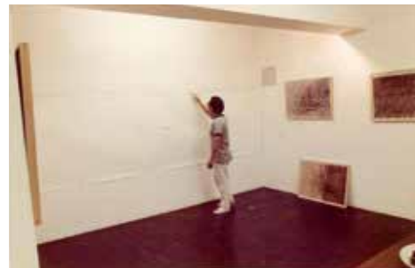
「パフォーマンスの様子」1980 (BOXギャラリー名古屋)